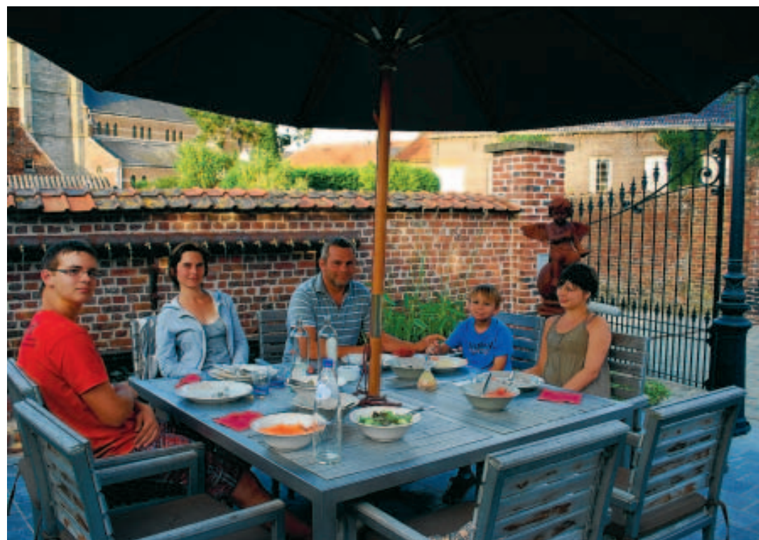
"On mange bien, dans la région", assurent ces Rochefortois qui passent leurs vacances à Celles.